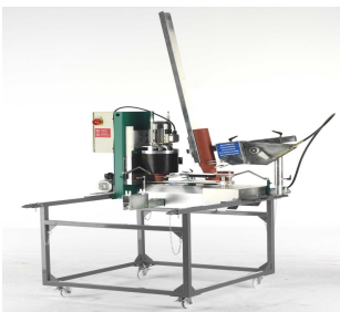
Chariot de transport et de stockage