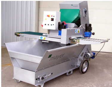
Module de remplissage MDR