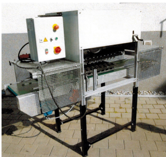
Système de forage automatique