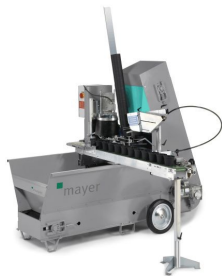
Module de repotage pour TM2105.