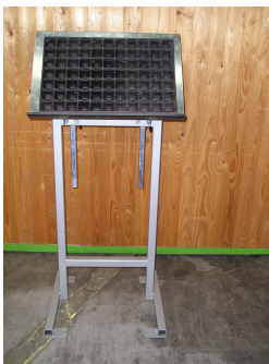
Pupitre de repiquage sur pied