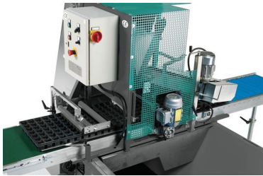
Système de remplissage basique (sans élévateur)