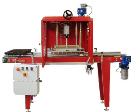
Unité de poinçonnage NF1