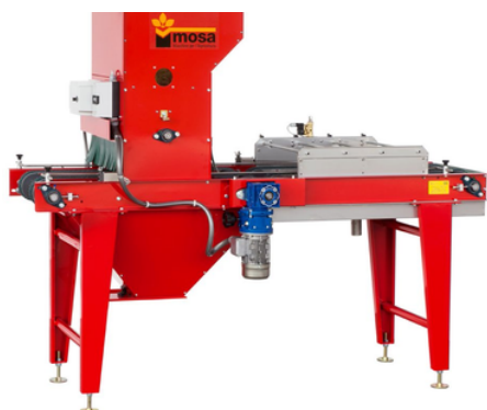
VP200 : Unité de couverture vermiculite et arrosage. Distribution de vermiculite par rouleau.